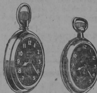
El Radiolite mas barato

Las horas y las manecillas brillan en la obscuridad como las estrellas en la noche y permiten ver la hora en la mayor obscuridad.